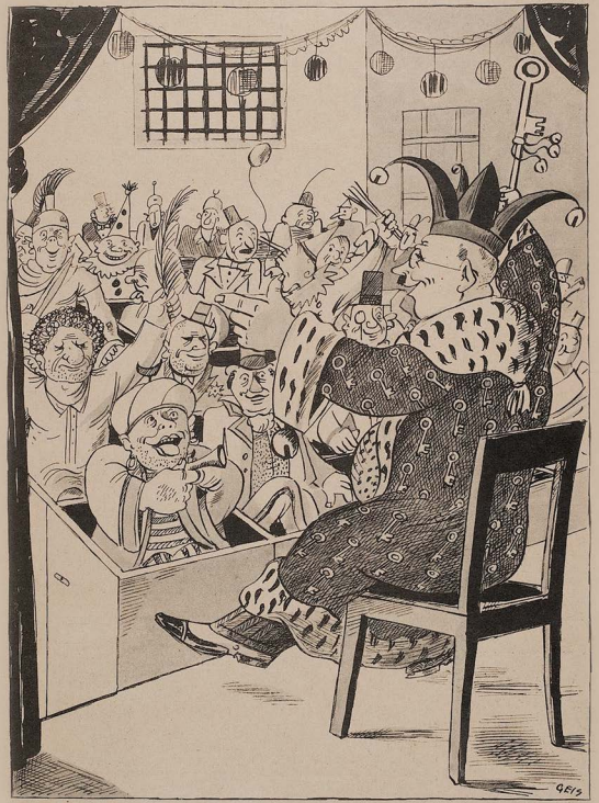
Der Zuchthausdirektor hat sich auf Wunsch seiner Häftlinge bereit erklärt, die Rolle des Prinzen Karneval zu übernehmen.