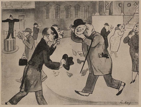
Die bayerische Regierung hat im München für die Faschingswochen einen "Heiteren Masken"-Zwang angeordnet. Man verspricht sich davon eine wesentliche Besserung der Laune der Bevölkerung sowie eine beträchtliche Hebung des Fremdenverkehrs!