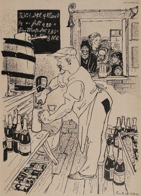
Um der Not der schwerringenden Schaumweinindustrie zu steuern, hat die Regierung nunmehr beschlossen, einem halben Liter Bier jeweils eine Flasche deutschen Schaumweins beizumischen. Eine Verleuerung des Bieres soll dadurch in keiner Weise eintreten, da eine geringe Quantilät des neuen Mischbieres dieselbe Wirkung hat wie die Zehnfache des alten.