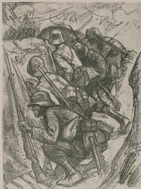
Vor dem Sturm

Da stand in dem Korporal der Entschluß fest: Wir gehen hinein und holen sie samt ihrem M.G. heraus!