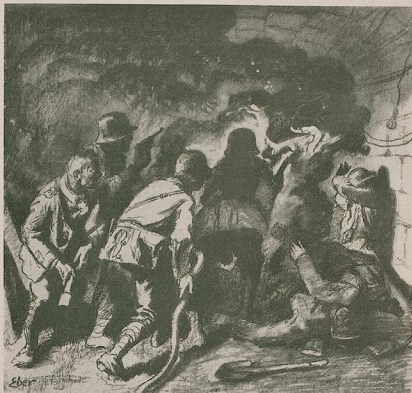
Flammenwerfer in den Kasematten in Fort Vaux